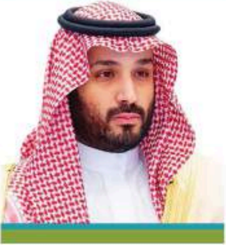
الأمير محمد بن سلمان بن عبدالعزيز آل سعود ولي العهد حفظه الله