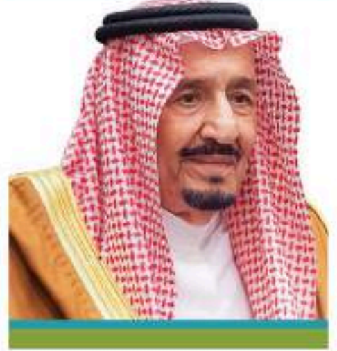
الملك سلمان بن عبدالعزيز آل سعود خادم الحرمين الشريفين حفظه الله