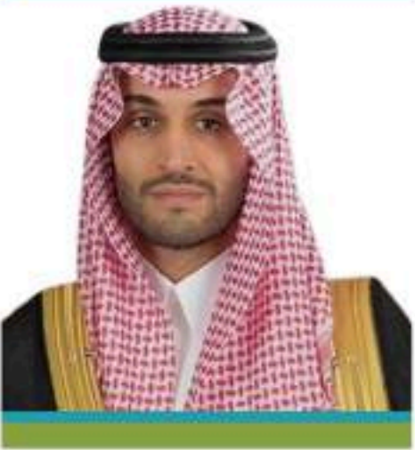
الأمير متعب بن مشعل بن بدر بن سعود بن عبدالعزيز نائب أمير منطقة الجوف حفظه الله