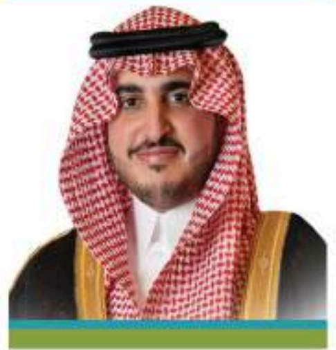
الأمير فيصل بن نواف بن عبدالعزيز أمير منطقة الجوف حفظه الله